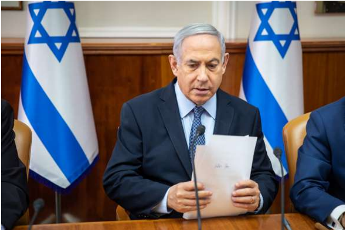
נתניהו. הורה לברגר לפעול בהתאם להנחיות של איתן צפרייר

ברגר: "האמת אין לי מושג. אני לא רגיל ולא בקיא בצורת עבודה כזאת. מבחינתי, אני אמשיך לעשות מה שנכון כל עוד לא יגידו לי אחרת. זו היתה מסוג השיחות המעורפלות האלה שלא מבינים מה רוצים ממך"